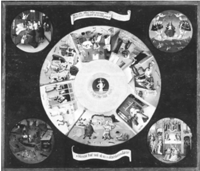
הירוניםמוס בוש - שבכת החטאים

נענשו, גם אם הכנסייה כינתה את מה שהטילה עליהם לעשות בשם "כפרת עוונות" ולא עונש. הוטלו עליהם תפילות, צומות, ועלייה לרגל לקברי הקדושים. באזורים מסוימים היה עליהם לצעוד בתהלוכה של יום ראשון בלבוש החוזרים בתשובה ונר בידם. לא בכל מקום התערבו השלטונות החילוניים, אך יש שהתערבו באכזריות. בערים אחדות בדרום צרפת היה על זוג החוטאים לרוץ עירומים ברחובות כשהם קשורים יחד בצורה משפילה וכל הרוצה בכך יכול להלקותם. לעתים ניתן היה להמיר את העונש בתשלום ולעתים ולא.