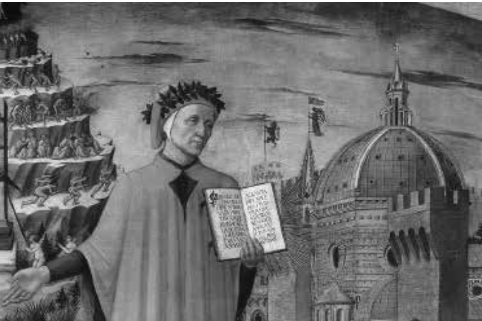
דנטה על רקע הפורגטוריום, פרט מצויר של דומניקו די מצ'לינו, 1465

(שיר 24, 38) בתופת של דנטה ובמציאות. בין היתר גם בפירנצה עירו שאליה הוא פונה במילים הבאות: "מפין הגנבים מצאתי חֲמֻשָּׁה/ מבני עירך, על כן כִּסְתַנִּי הכלימה" (שיר 26, 4-5).