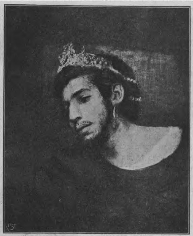
אבטופורטרט בתור «אהשוֹר»

אי-מנוחה ומצב חמרי קשה (אביו נתרשש) מביאים אותו שוב לווינה בשנת 1877. הוא לומד אצל אנגלי. צייר היסטורית. שלא ידע להתרומם מעל לדורו ובצבעיו עמד חחת השפעת מקרט. אבל דוקא בסביבה זו פעל גוטליב רבות. אפשר לאמר. כי את האינטנסיביות הרבה ביותר השיג בווינה. התמונה «אוריאל אקוסטא ויהודית». שעליה חשב עוד במינכן. נגמרה כאן והוצגה ב«קינסטלרהויז». בתמונה היתה המסכת היסטורית. אבל בשום פנים אין להכניסה לסוג «התמונות ההיסטוריות». שהרי חוץ מההדור המציין את אלו. יש כאן קומפוזיציה לא-אטומה. יש חופש הקו. ובמקצת – גם הבעה חזקה. יהודית חיה ונושמת. היא אינה «מצוירת». לא צבע. אלא דם נוזל בעורקיה. ואף ביחס לגוונים זו גוטליב ססיעה אחת קרימה. אם ב«שיילוק ויסכה» היה בו עוד משהו מצבעי-הדור החומים. «הציר החום»