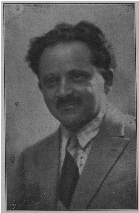
כ"ב תמוז תרפ"ט – כ"ב תמוז תר"ץ