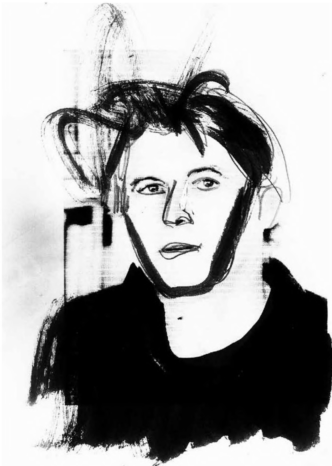
צייר: רוני סומק, מתוך התערוכה: תמונה קבוצתית עם חברים, מוזיאון רמת גן