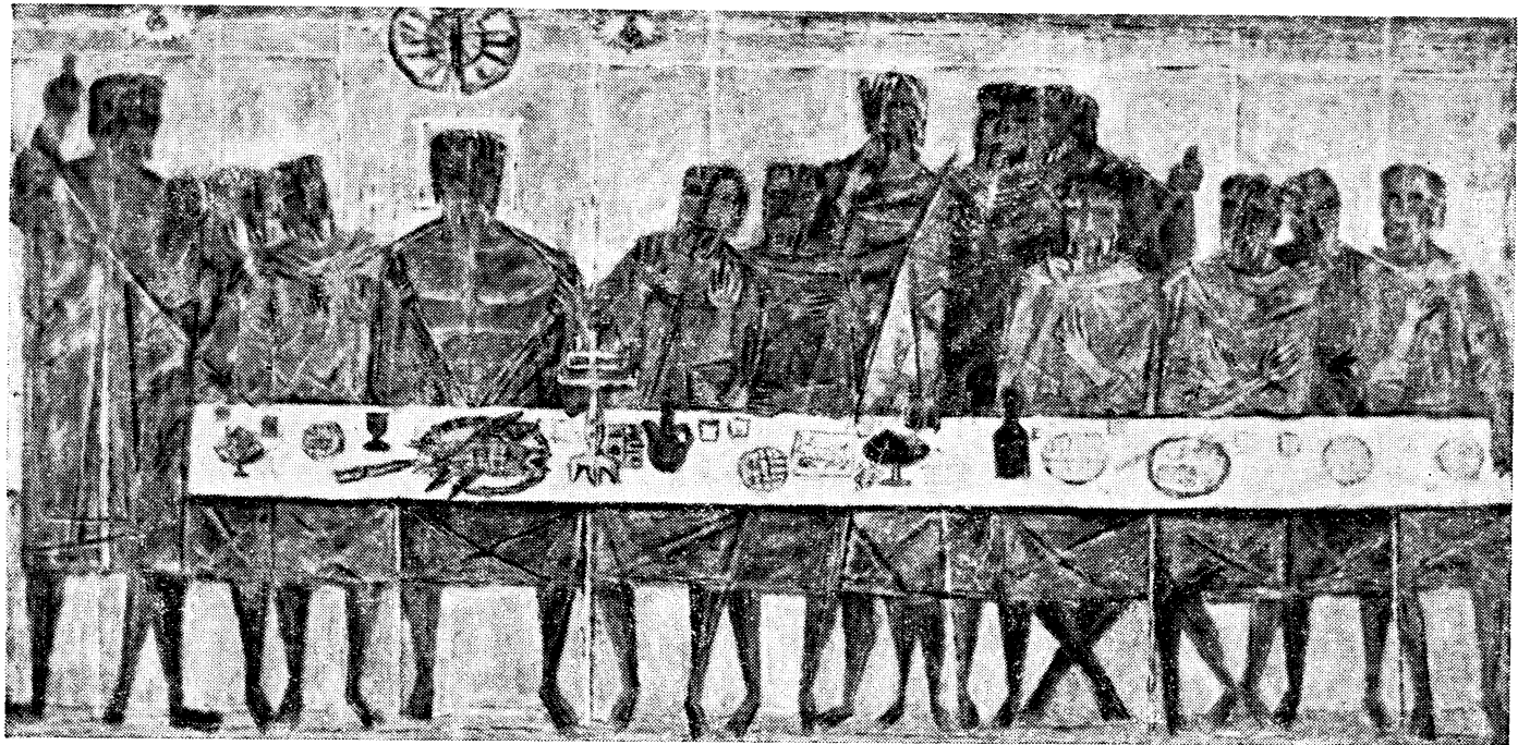
(סקיצה בטמפרה לציור 'קיר)