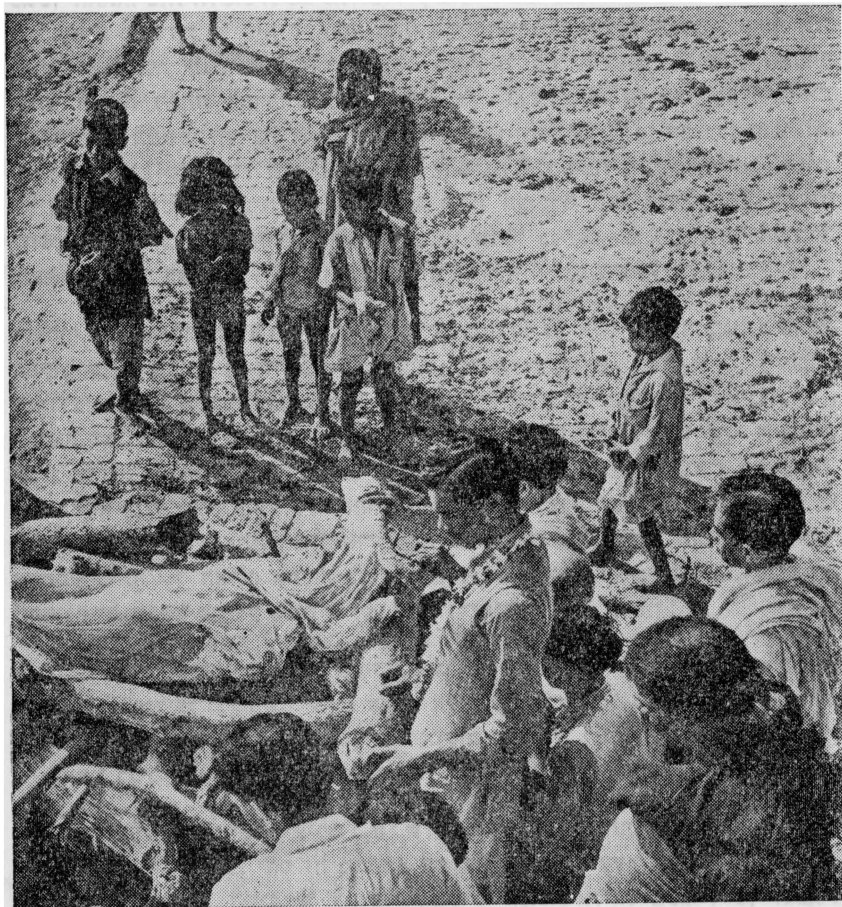
משפחה אמידה עומדת לשרוף את אמה הזקנה בעיר הקדושה בגארס

הקולוניאלית לבין תרבותם המקומית מוכחת עליונותה של התרבות הזרה. אופני סיבה זו הוכתרה דרך-כלל בהצלחה, שנסתייעה לא מעט בגורם בלתי-המודע שפעל באוכלוסייה המקומית. כך, למשל, הצהיר שר-החינוך של יפאן עוד ב-1854, בעקבות כניעתה לאולטימטום האמריקאי, כי חולשתה של ארצו, שפפתה עליה את הכניעה בפני המערב, היא תוצאה ישרה מעדיפותה הצבאית של ארה"ב; עדיפות שהנה ללא ספק אות מובהק ליתרונה של התרבות האמריקאית המערבית על תרבותה של יפאן. התוקפנות הרוחנית, מודעת כבלתי-מודעת, בלטה בראש-ובראשונה בתחום הלשוני. לכלל ביטוי קיצוני בא הדבר, למשל, ביפאן, בה הציע