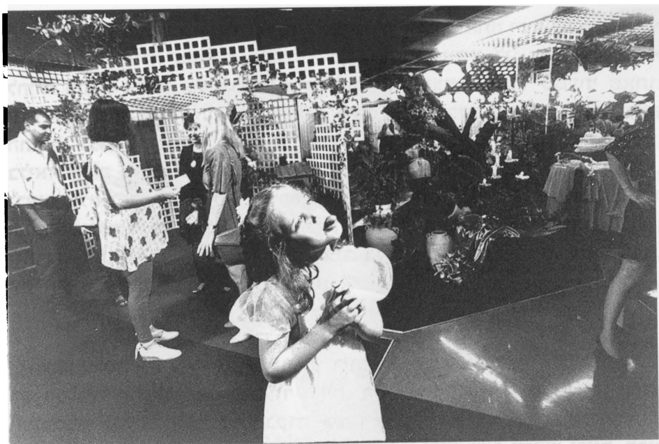
חתונה, עכו 1995, צילום: אייל לנדסמן

בקיצור, אמרתי לה, די עם הבלבול ביצים הזה, הזין שלי מתפוצץ, קדימה, תראי לי איך עושים את זה. היא נשכבה, הכלבה, היה שם ספסל צר כזה, נשכבה עליו, פתחה את הרגליים, ואני בליאד לא מצליח, פעם גבוה מדי, פעם נמוך מדי, בקיצור שעה עד שנכנסתי לשם - כוס בגודל של שני אגרופים, אני מיטלטל שם בין הקירות... היה מגעיל לאללה, וכבר לא רציתי. אבל המשכתי לבוא. חצי שנה הזדיינו. היא היתה מוזרה, אתה נוגע בה והיא רועדת, פחד מוות. אבל זה שטויות, אני אחרי הצבא תפסתי תאוצה, כבר הייתי נשוי ועבדתי בגורגז 3 .