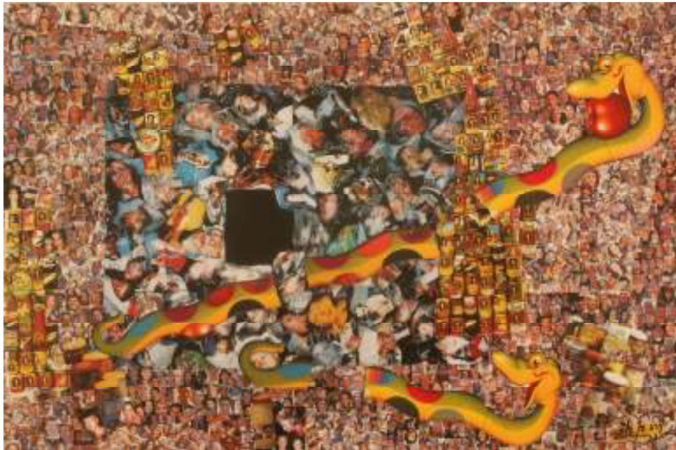
יערה בן-דוד, התפוז הגדול, קולאז' (2006)