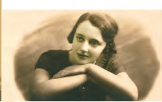
לאה גולדברג בנעוריה

בחום בחיק משפחה גרמנית-נוצרית; ניסתה כוחה – בפעם הראשונה והאחרונה בחייה – בחיבור יצירה בגרמנית... זכתה לשבחים על יצירותיה מפי אבי המשפחה...” (עמ' 329). העיון בספרה של גולדברג מזכיר לי גם את ההיזכרות של ז'בוטינסקי באודסה רגע לפני שנפלה עליה מלחמת העולם, ברומן היפיפה שלו חמישתם: