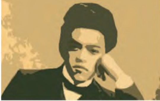
זאב ז'בוטינסקי הצעיר (עיבוד גרפי)