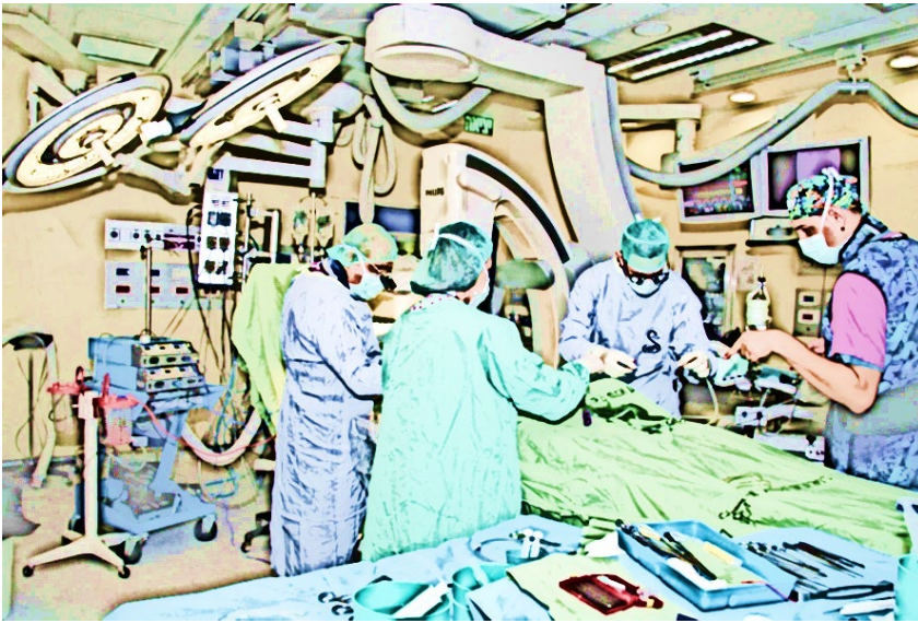
רופאים בחדר ניתוח - עיבוד גרפי

הנְמַרְחַת עַל הָעֲצָבִים הַחֲשׂוּפִים מְעַנֵּין לְרֵאוֹת לָהֶם אֶת הַפְּרָצוּפִים שֶׁל כָּל אֱלוֹ עִם הַבִּיאּוֹפְסִיָּה וְשִׁמְיֵאוֹפְסִיָּה וְדָגָם הַשׁוֹחִים בְּרִפְסוּדִיָּה אֲנִי בְּסֹדֶר כָּלֵם טוֹעִים גַּם הַכְּבָשִׁים וְגַם הַרוֹעִים דִּי עִם זֶה, זֶה מִמָּשׁ לֹא נָעִים וְטַעַם הַחַיִּים שֶׁהִיָּה טָעִים עוֹבֵר לְפָסִים וְלַחַיִּים מְשַׁגְּעִים כְּמָה פְּרוֹפְסוּרִים כְּבָר רֵאִיתִי? פְּחוֹת מְאֹרְבָּעִים. רַק שִׁשָּׁה עֶשֶׂר וְלִכְל אֶחָד דָּעָה וְלִכְל אֶחָד עֶרְף וְאֲנִי מִתְבַּלְבֵּל וּמֵאֲבֵד אֶת הַדֶּרֶךְ