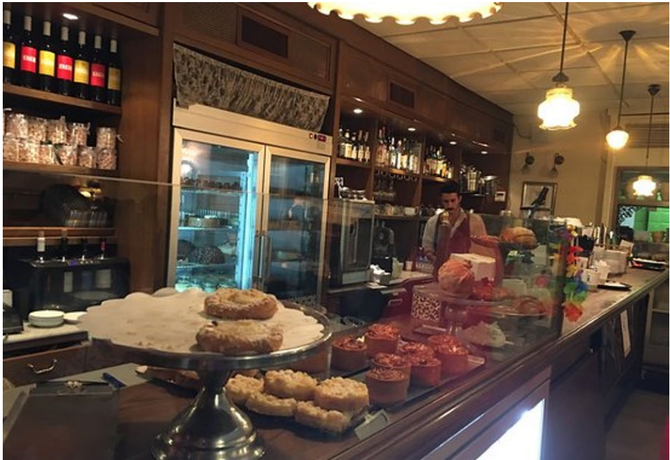
בית קפה ירושלמי

מה פתאום מיתי, מה פתאום אולימפוס, לא זה ההקשר. מדובר ברקע אחר, בתקופה אחרת. מדובר בחלום, חלום של פזורה, חלום של גלות, חלום של מיליוני לבבות, חלום של עם, מאות, אלפי שנות געגועים וערגה מקופלים בארבע המלים בתריסר האותיות. בטח היה איזה שישקע, שליח, פונקציונר, פקיד בכיר, מאכער, שינו את שמו אז, כששינו שמות.