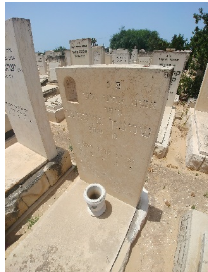
אבן, לא אבא, ואף על פי כן בית-הנר עקור ולא לראשונה והאותיות דהו

עלי להתוודות, שלא לעיתים קרובות אני מגיעה לקברי הורי, טכסים, בתי קברות, אבני מצבה - זרים לי, חכמת עגל מלומדה, אני שם, כך עושים כולם, כך צריך, כך נהוג. אני עומדת מול המצבה כמו פוץ, לא זו בלבד שהאבן אינה נוגעת לליבי, אלא אני מתמלאת ניכור, כעס, אני נאטמת, דבקה באבן. אני אבן.