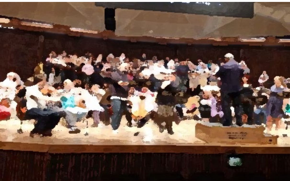
מנצח מול תזמורת סימפונית