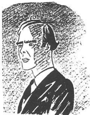
תמונה 1 - אבא של לי