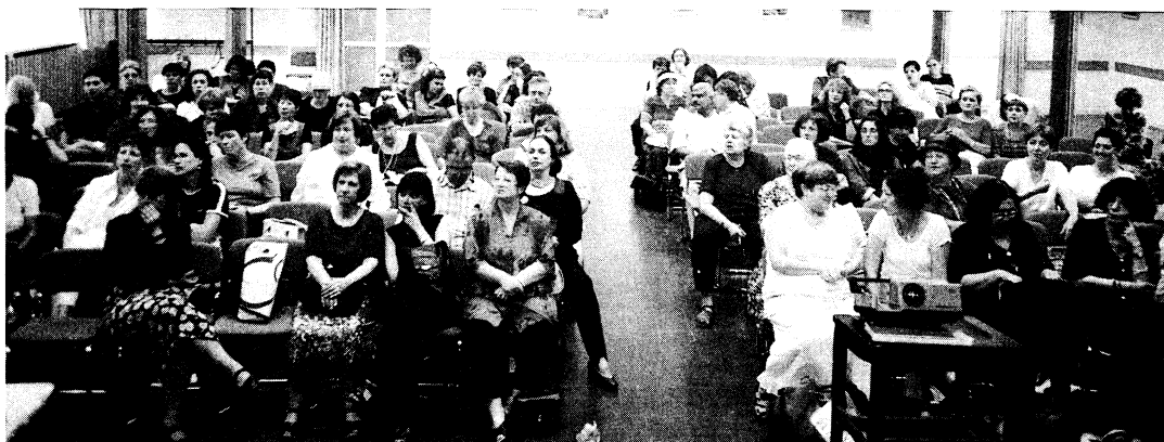
קהל המשתתפים בכנס

אני מאחל לכולם האזנה נעימה. יש כיבוד בהפסקה. בתיאבון!