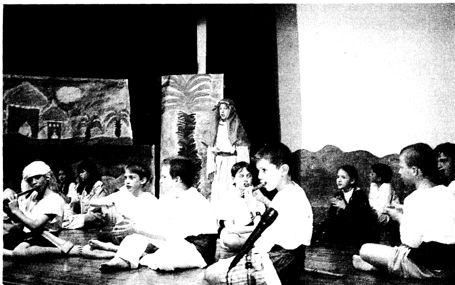
ילדי כיתה ד' של בי"ס אדם בהופעה.

אנו עושים עבודה חשובה ביותר. אנו בונים את הדור היהודי החדש והממשיך ושומרים על הגחלת שלא תכבה.