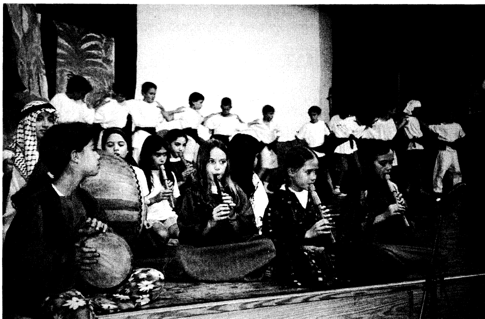
ילדי כיתה ד' ב"ס אדם בהופעה

לא בכדי טען ג'ון דיואי, המחנך והפילוסוף, כי ביה"ס אינו הכנה לחיים, כי אם החיים עצמם.