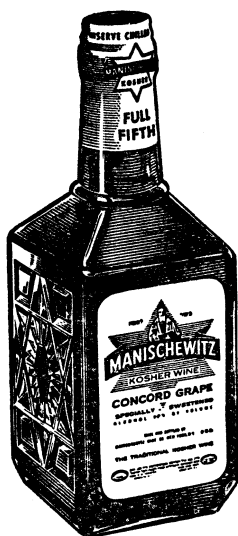
#111 FIFTH, CONCORD

E X T E N D S G R E E T I N G S T O A L L I T S G O O D F R I E N D S