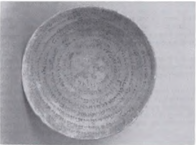
קדירת קסמים ב'. מאוסף מוריה