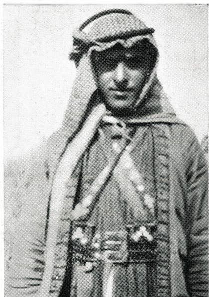
בדוי משבט וולד-עלי