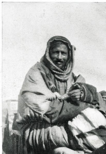
בדוי משבט ענזה