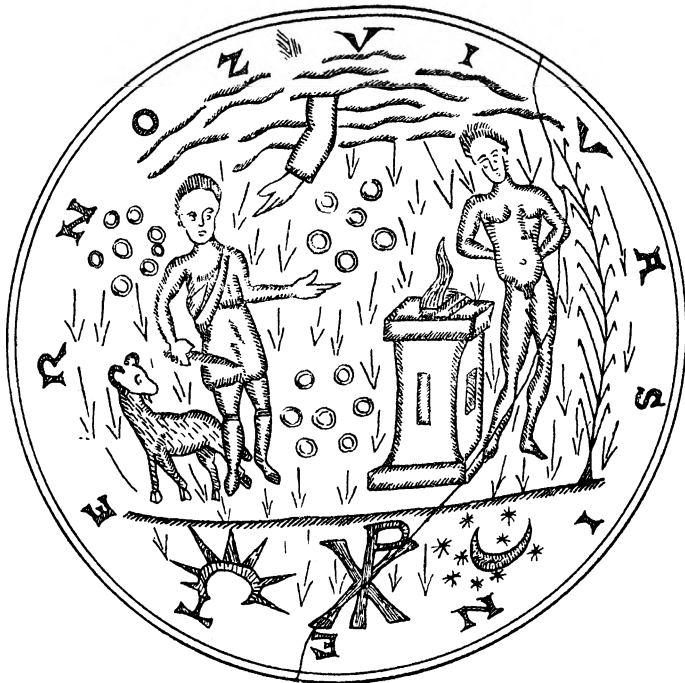
קרקעית של כוס ועליה חרות ציור העקידה