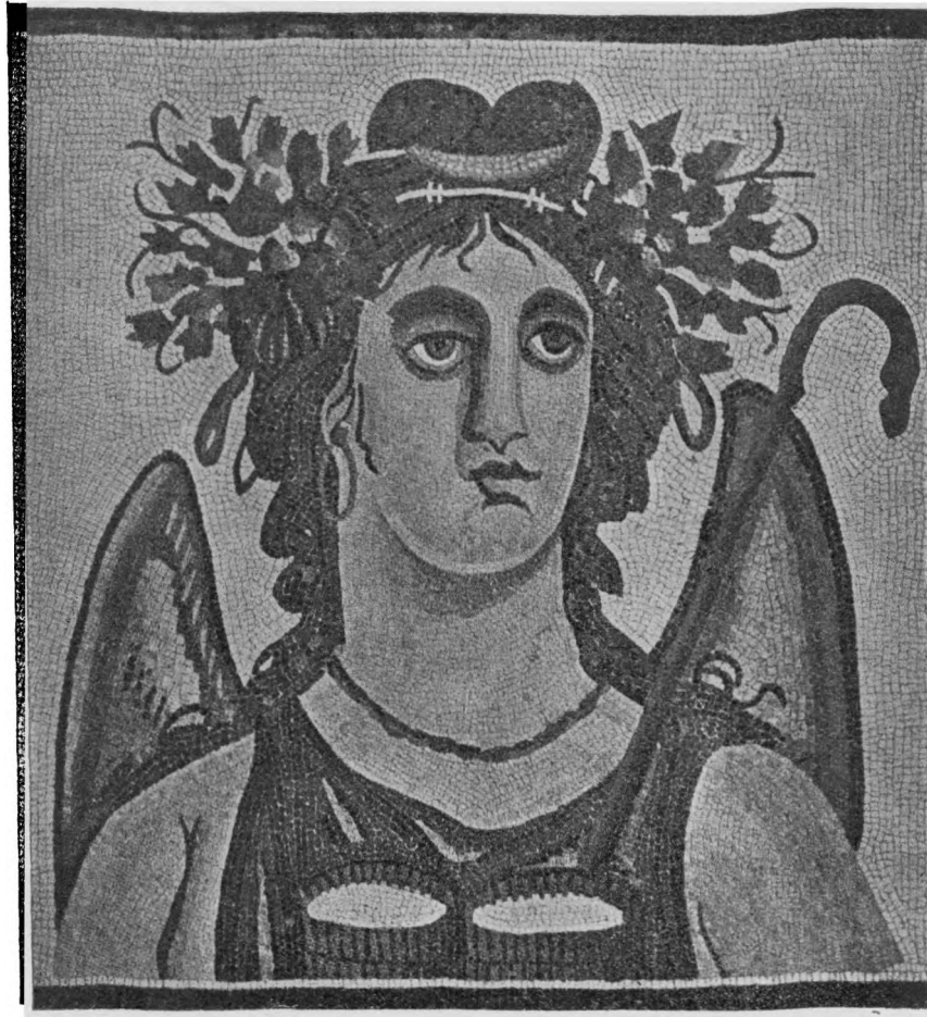
סמל תקופת האביב בפסיפס רומאי באפריקה הצפונית