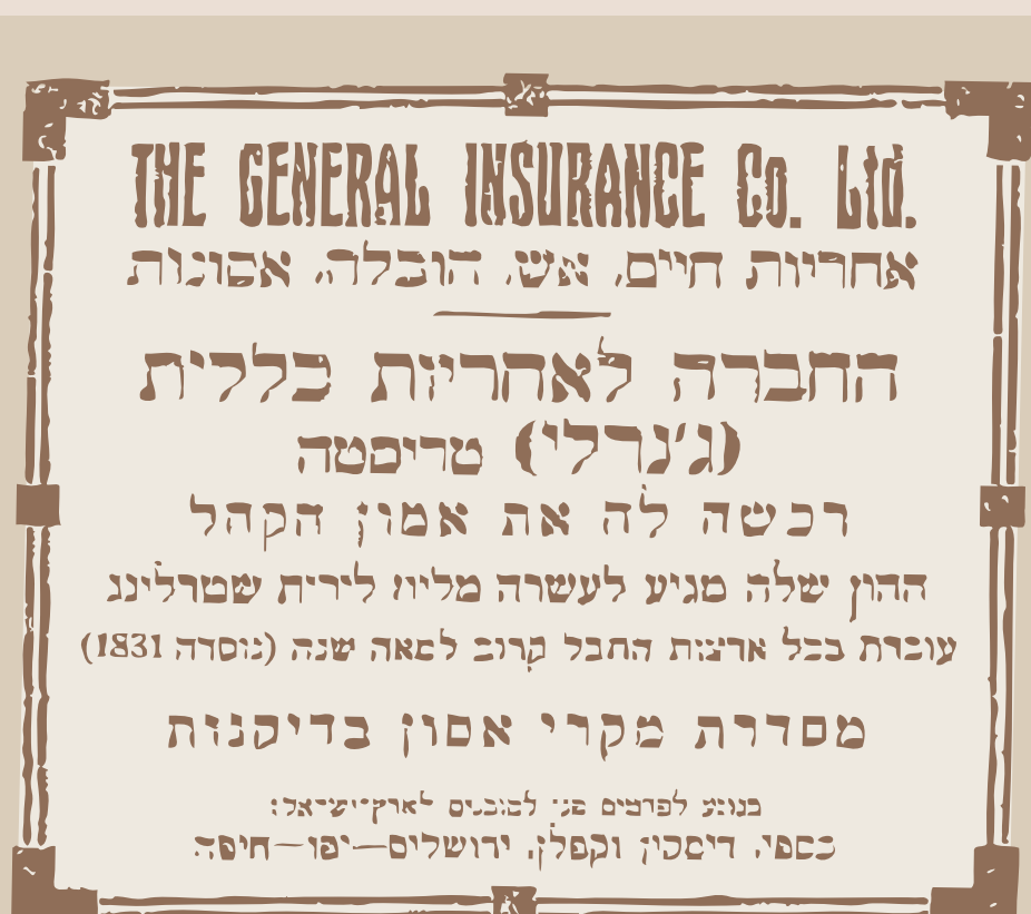
דבר, יולי 1927