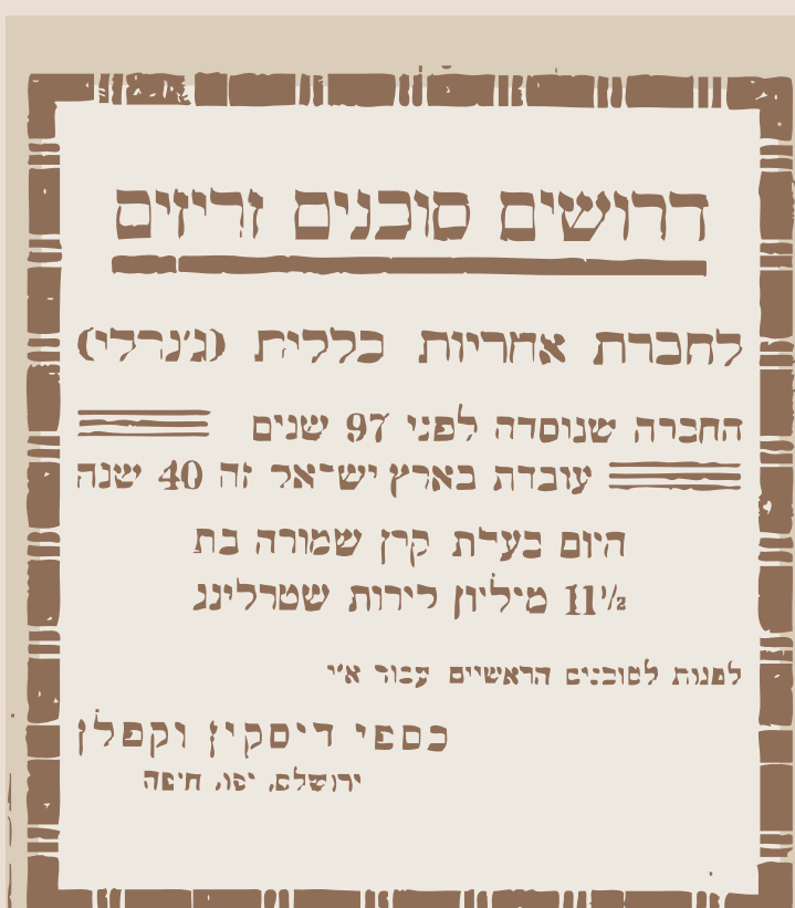
דבר, ספטמבר 1928