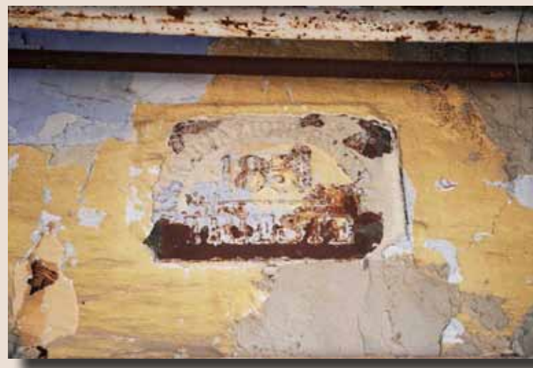
סימן האש כפי שנחשף בקיר בית הדפוס

סימני האש הופיעו בעולם לאחר השריפה הגדולה בלונדון בשנת 1666, בה נהרסו כשני שלישי מבתי העיר. בעקבות השריפה, נוסדו חברות ביטוח שהציעו פיצוי במקרי שריפה ופעלו במשותף עם חברות כיבוי אש פרטיות לצמצום נזקי האש והסיכון לאובדן רכוש ונפש.