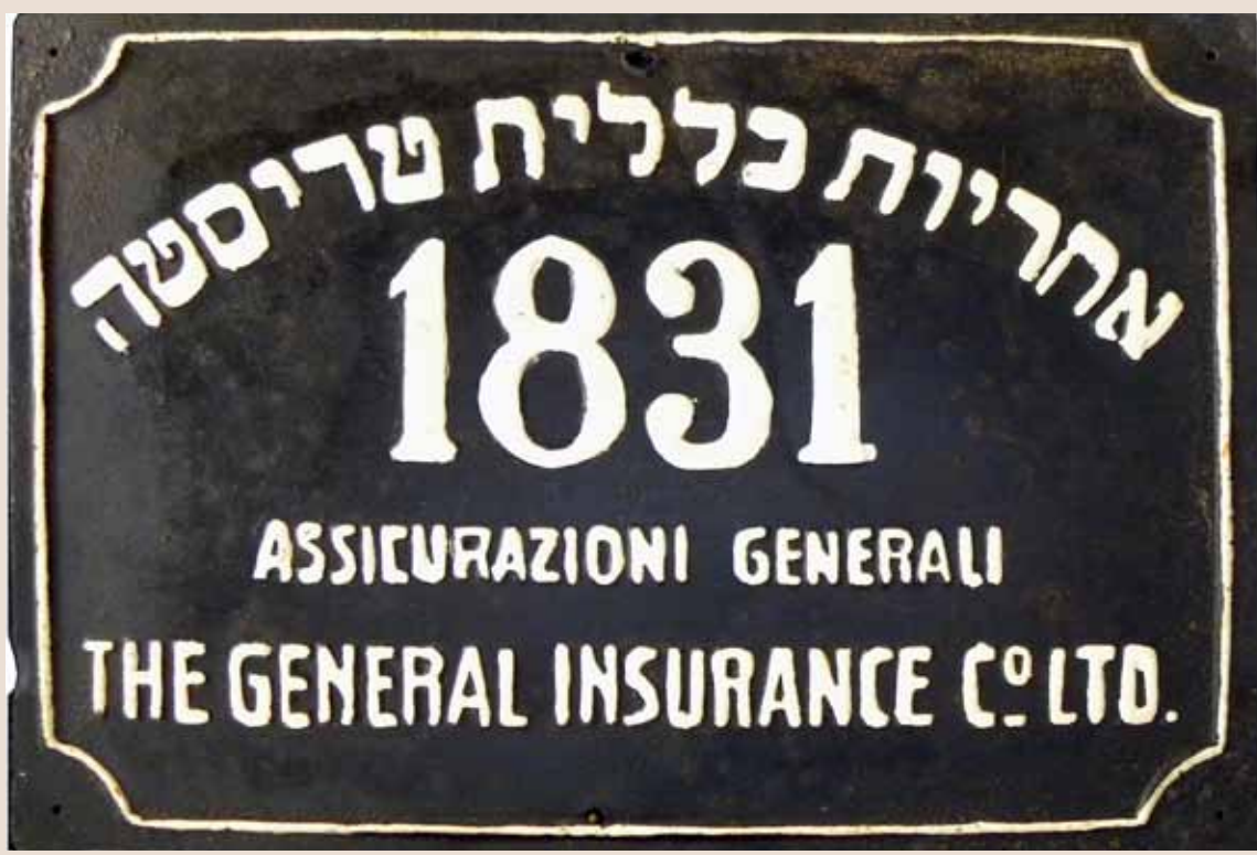
דגם סימן אש ג'נרלי בעברית