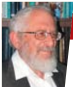
הרב ישראל רוזן ראש מכון 'צומת'