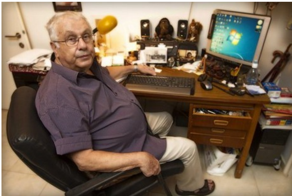
"שום הוצאת ספרים לא היתה מוציאה לאור את 'מסעותיי עם נשים', וגם אם היו כאלה שמסכימים, הייתי ודאי לוקח חזרה את כתב היד לאחר ויכוח קשה עם העורכות"

"לא הרבה. אמנם למדתי שנים רבות בחוג לפילוסופיה יהודית וקבלה בירושלים אצל פרופ' גרשם שלום, וגם קיימתי איתו את הראיון החשוב 'היהדות היא דיאלקטיקה של רציפות ומרד' בספר הראיונות שלי 'אין שאננים בציון' מ-1986. אבל ב'מסעותיי עם נשים' אין ענייני קבלה ולילית. הם יהיו, כך אני מקווה, ברומן ההיסטורי הארצישראלי רחב היריעה שאני עובד עליו שנים רבות, 'והארץ תרעד', שמכסה תקופה רחבה יותר מזו של תולדות משפחתי בפתח תקווה".