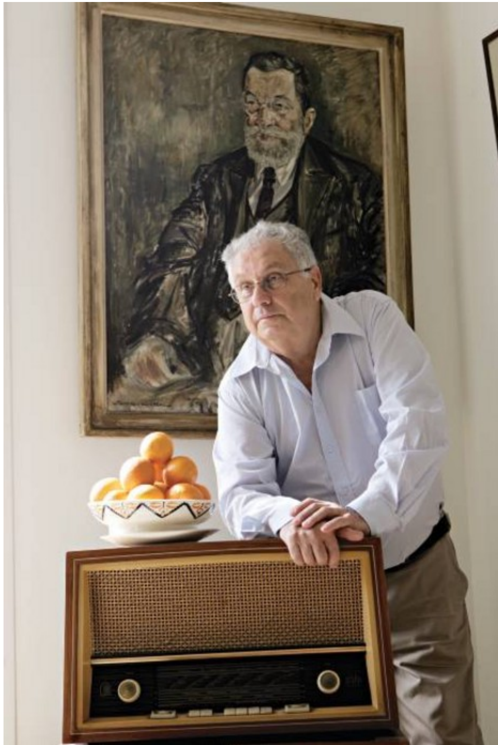
"תחילה קראתי לרומן בשם 'ג'ני מלכת הנגב' ורציתי להמשיך לפתח את הדמות שלה מאז שהתעלסתי איתה במלוש של המאפיייה שלי בעין גדי לפני יותר מ-50 שנה"

אתה כותב על שפתו הבלתי נהירה של ס. יזהר, על סילבי קשת, על יגאל מוסינזון, על השפה הקלוקלת השגורה כיום, שאינה מבדילה בין זכר לנקבה, על נביאי השקר שהתקשורת נוהגת לטפח ועוד. מה יש מאחורי הביקורת? אני לא לגמרי מזהה את הטון. האם הוא מחויך ומפויס, או שאולי כועס ושואף לתיקון?