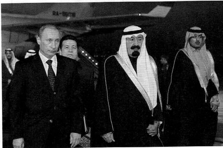
בוטין ומלך סעודיה עבדאללה. מנהיגים מדינות של טריק אחד, הנפט. וכשהטריק מתפוגג, הצרות מגיעות

נוספים. אבל ההשקעות שלה לא מתוחכמות. הם קנו עסקים באירופה ובארה"ב. קנו למשל את מלון הרוסד והשקיעו בנדל"ן. אבל הם לא מביאים אליהם תרומה ייחודית. הם רק קונים יחידות מוכנות. לכן כשהבסיס הפיננסי יתכווץ הם יאלצו גם למכור. אני עוקב כבר שנה אחרי קטאר והרכישות שלה. היא קונה כמעט כל דבר שזו.