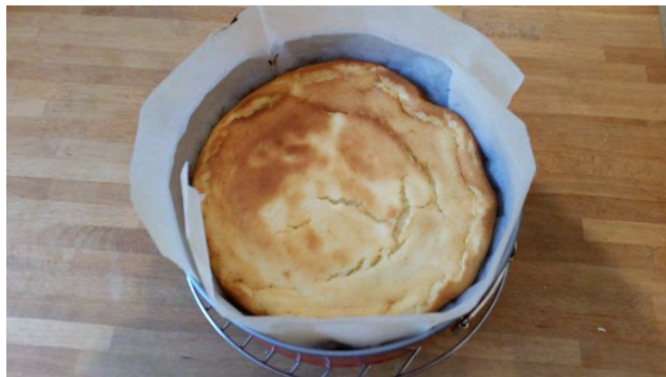
המתכון המקורי של יועד שירן

לאחר שהעוגה מוכנה והתקררה מעט, מומלץ לפתוח את התבנית ולהוציא את דף האפיה.