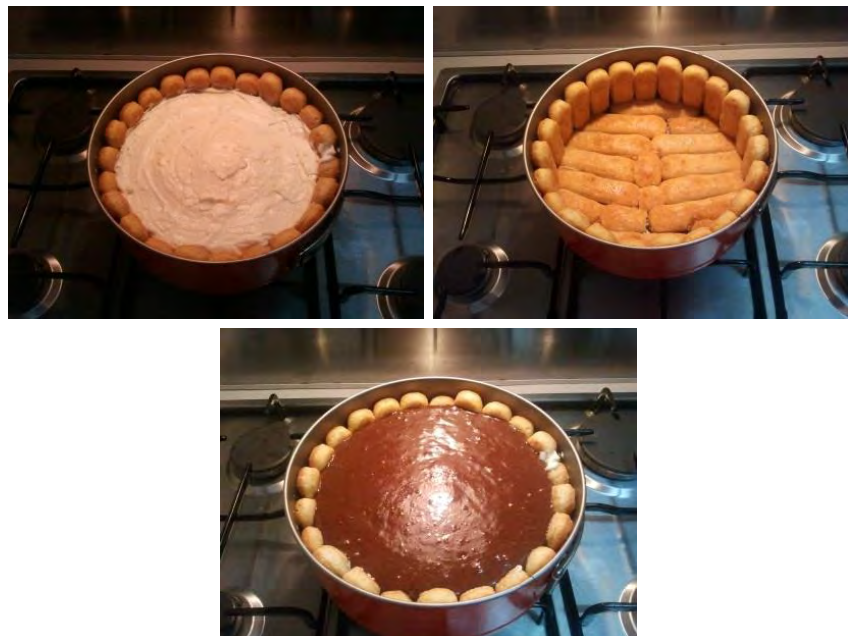
המתכון המקורי של דפנה פלצ'י.

מכסים בניילון נצמד ומכניסים למקרר למספר שעות (עדיף ללילה). לפני ההגשה, מעבירים בעדינות סכין בין הבישקוטים העומדים לדפנות התבנית.