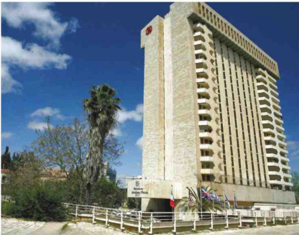
מלון לאונרדו פלאזה בירושלים (שרתון לשעבר)

שהוא מתבייש במקצוע. "כשמזמינים אותי להרצאות אני מסביר למה אני מתבייש להיות אדריכל. השכר שלי נחשב לגבוה, אבל אני לא מרוויח יותר מכל אדריכל אחר – כי אני לא לוקח עמלות מבעלי מקצוע ומחברות ומאף אחד". הוא מתכוון לכך