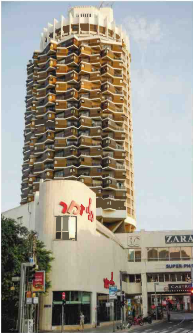
מגדל דיזנגוף בתל אביב

"אני לא מרוויח יותר מכל אדריכל אחר כי אני לא לוקח עמלות" – הוא מתכוון לרבים שלוקחים עמלות מקבלנים, ספקי זכוכית, קרמיקה, אריחים ועוד. "זה זוועה, זוועה, אני לא יכול לדבר על כך, כי זה גם חברים"