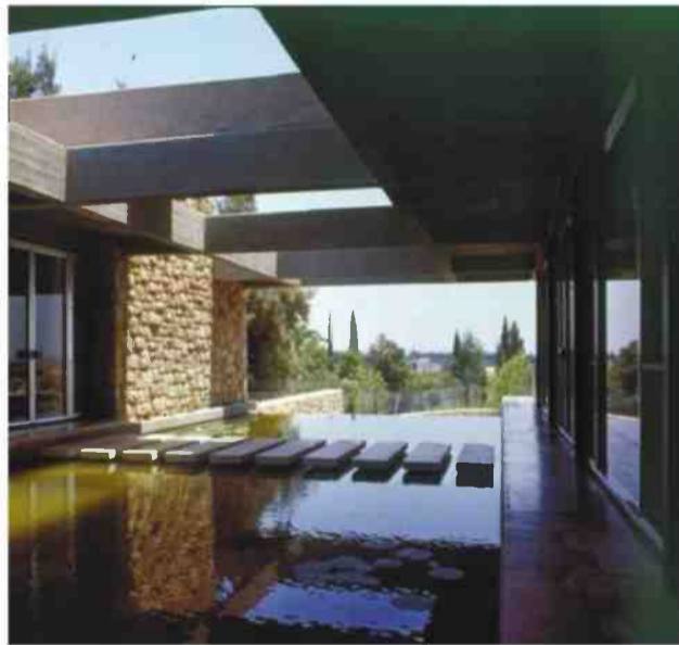
בית שאול איזנברג מבחוק, וחדר בפנים

שכבר תכננתי כמה בתים בסביון, אבי דיבר עם המתווך של אפריי- קה-ישראל שהיו בעלי הקרקע, אותה רכשו ממנהל מקרקעי יש- ראל. כשבת בדיוק היה פחות בשער הדולה, מ-1.8 ל-1.3 לירות, והם לא רצו למכור. בסוף הם אמ- רו — אם תבטיח לנו שתכנון פה וזה לא למכירה, תקבל את זה במ- חיר הקודם בדולרים. זה עלה לנו רק 3,000 דולרים לכל מגרש