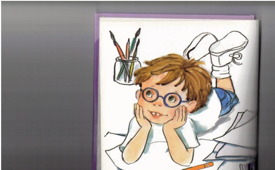
איור: נורית צרפתי